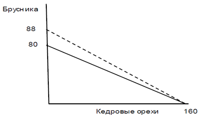
Рисунок 1- Кривая производных возможностей

Для бригады из восьми человек дневная производительность будет составлять: 8 \cdot 20 \text{ кг} = 160 \text{ кг} кедровых орехов и 8 \cdot 10 \text{ кг} = 80 \text{ кг} брусники. Чертим кривую производственных возможностей (рисунок 1).