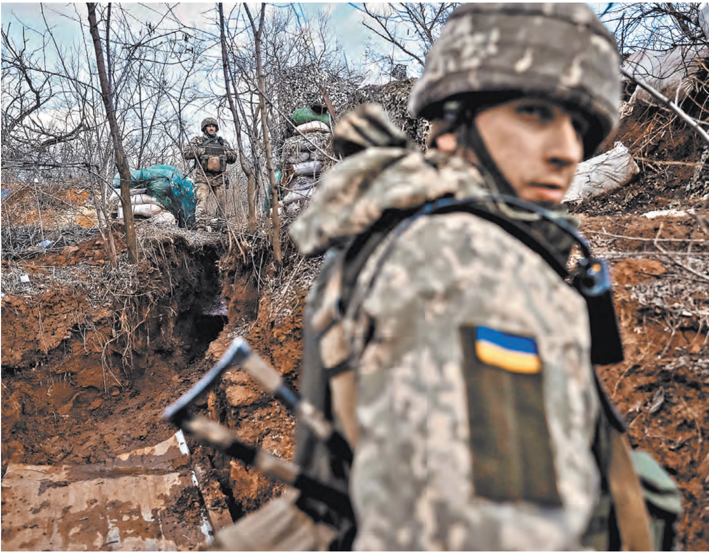
Украинские неонацисты ставят перед собой задачу лишить российский народ исторической памяти, традиций и языка. Ничего у них не получится.