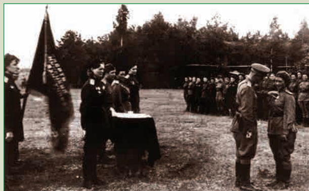
Вручение наград. 46-й гв. нбап. 1943 г.

40 лет спустя. Встреча ветеранов 46-го женского авиаполка. Художник С. Бочаров