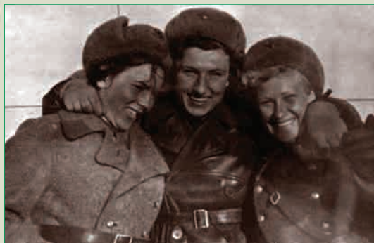
Зимняя форма одежды лётчика. 1941 – 1945 гг.