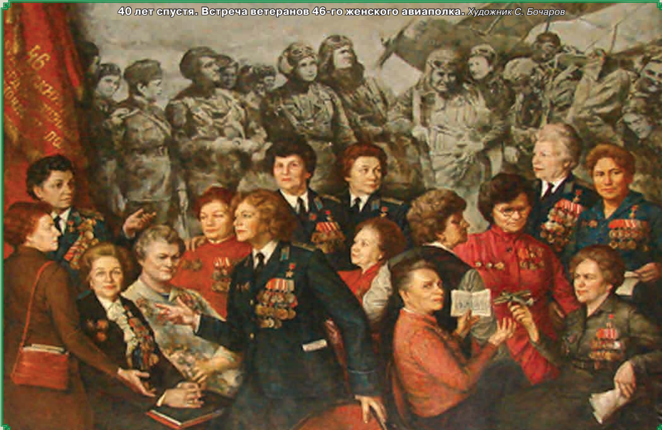
Фото из Центрального дома авиации и космонавтики РОСТО (Москва) и книг: Кибовский А.В., Степанов А.Б., Цыпленков К.В. Униформа Российского военного воздушного флота: В 2 т. М., 2007. Т. 2. Ч. 1; Сила слабых. Женщины в Великой Отечественной войне 1941 – 1945 гг. СПб., 2005.

40 лет спустя. Встреча ветеранов 46-го женского авиаполка. Художник С. Бочаров