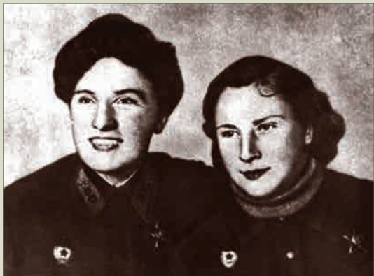
Лётчики-истребители Екатерина Буданова и Лилия Литвяк