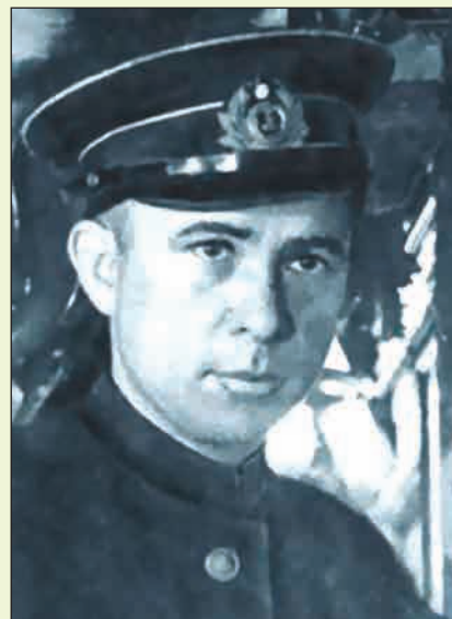
▲ А.И. Маринеско Фото, вероятно, 1944 года

▶ Директор музея капитан 1 ранга запаса И.И. Пахомов