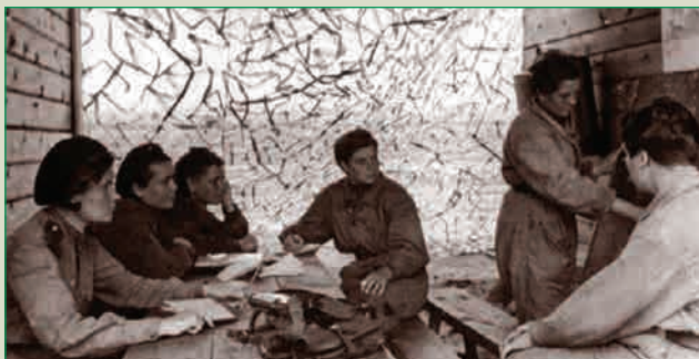
Эскадрилья на занятиях по тактике воздушного боя