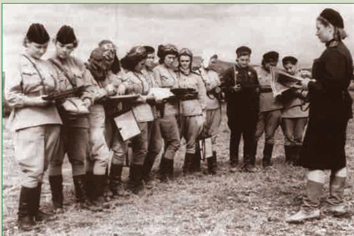
Постановка задачи. 46-й гв. нбап. 1943 г.