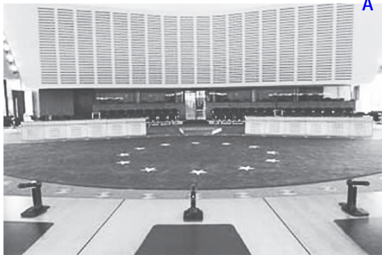
Зал заседаний Европейского Суда по правам человека

Событие, которого мы ждали так долго: Всей страной в Европейский Суд по правам человека