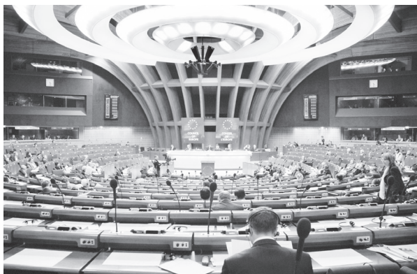
Зал заседаний ПАСЕ

Полная стоимость пребывания во Франции специалистов — юристов, работников образования и других — около 100 тыс. рублей (≈ 2,5 тыс. евро) и будет уточняться в каждом конкретном случае (в зависимости от уровня (звезд) гостиницы, рациона двухразового питания; индивидуальных или групповых услуг переводчика, сопровождающего по Страсбургу и близлежащим пригородам). Возможна поездка в Германию (в приграничные города — Кель, Оффенбург и т.д.) в свободный день участника семинара.