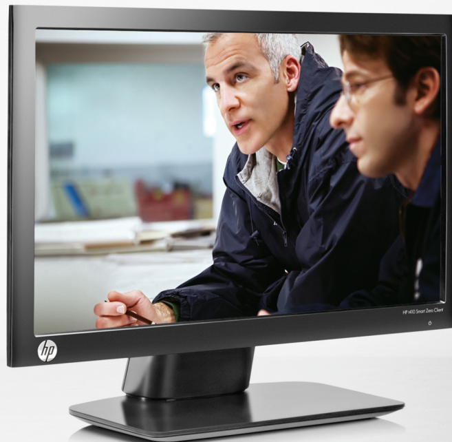
НОВЫЙ моноблок HP t410