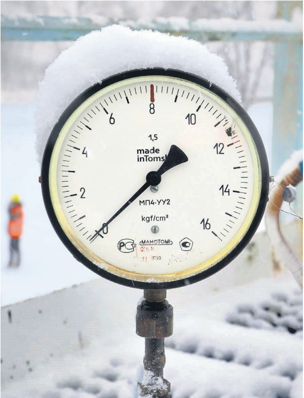
Давление российского газа в Европе резко упало, но полностью прожить без него она пока не может

Глава Еврокомиссии Урсула фон дер Ляйен ожидает, что ЕС в 2023 году закупит до 130 млрд кубометров газа, что сопоставимо с поставками текущего года. По ее мнению, блоку необходимо ускорить внедрение ВИЭ и активизировать меры, направленные на повышение энергоэффективности, а также приступить к совместным закупкам газа.