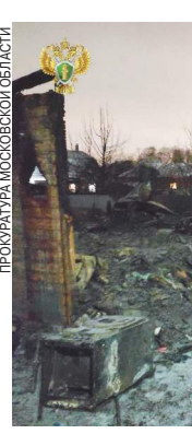
Пожар в Московской области.