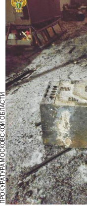
Пожар в Московской области.