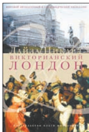
Пикард Л. Викторианский Лондон / Пер. с англ. В. Кулагиной-Ярцевой, Н. Кротовской, М. Бурмистровой.

5 Сколько бы ни писали о Лондоне, период царствования королевы Виктории (1837—1901) неизменно привлекает исследователей и читателей. Первые линии метро, каменная набережная Темзы, продвинутая канализация, новые направления в литературе и искусстве. И все это — на фоне будней среднего класса.