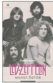
Дэвис С. Молот богов. Saga о Led Zeppelin / Пер. с англ. С. Рысева.

7 Наконец-то книга «Hammer of the Gods: The Led Zeppelin Saga», написанная известным музыкальным журналистом Стивеном Дэвисом в 1985 году, появилась в переводе на русский. Естественно, главными героями книги являются музыканты Led Zeppelin — со всеми их достоинствами и недостатками.