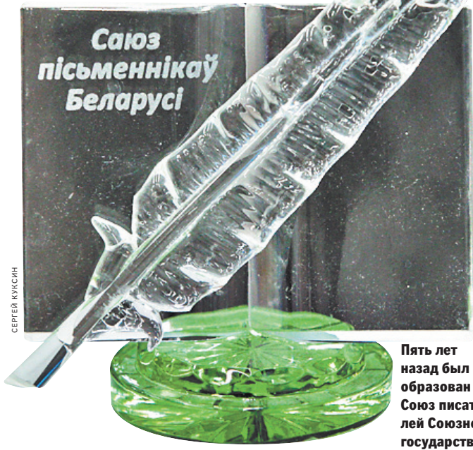
Пять лет назад был образован Союз писателей Союзного государства.

тервью, исследования». Книга — победитель нынешнего года, посвященная кумиру моей молодости Владимиру Мулявину.