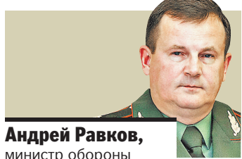
Андрей Равков, министр обороны Беларуси:

ВО ВТОРНИК в Смоленске стартовал Х велопробег Союзного государства «Молодежь России и Беларуси — дорога в будущее Союзного государства», который финиширует в воскресенье в Минске. Общая протяженность трассы — более 800 км. Участники пробега — молодые парламентарии, лидеры молодежных общественных организаций, студенты, работающая молодежь. По пути они посетят мемориальные комплексы, возложат цветы к памятникам погибшим воинам, примут участие в митингах, спортивных праздниках и концертах.