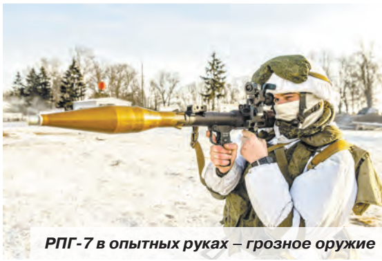
РПГ-7 в опытных руках – грозное оружие

Фото Константина Морозова Московская обл.