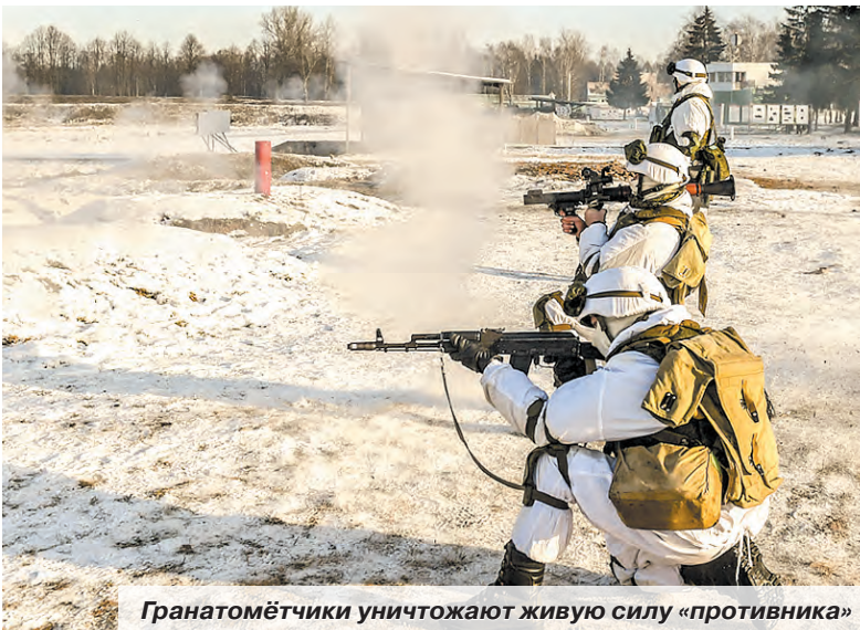
Гранатомётчики уничтожают живую силу «противника»

В войсках округа набирает ход зимний период обучения. В гвардейской армии танковой армии прошёл учебно-методический сбор гранатомётчиков. На заключительном его этапе на подмосковном полигоне Алабино гвардейцы Таманской мотострелковой дивизии провели боевые стрельбы из РПГ-7 и АГС-17.