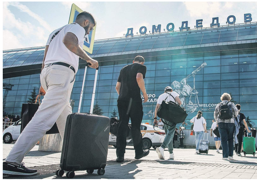
Степан / Известия