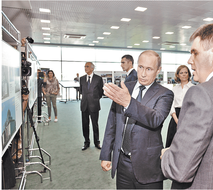
На правах хозяина экскурсию по павильону для гостей провел Посол Беларуси в России Игорь Петришенко.

Напомним, что павильон «Республика Беларусь» (прежде — Белорусская ССР) на ВДНХ — это исторический памятник всероссийского значения, и через два года он отметит свой 80-летний юбилей. Поначалу павильон, построенный в 1937 году, был деревянным. Его открытие было приурочено к началу работы Всесоюзной сельскохозяйственной выставки. Во время Отечественной войны и до 1949 года павильон был закрыт. Возведен заново из камня к выставке 1954 года архитекторами Г. Захаровым и З. Чернышевой. Это трехъярусная постройка с монументальной колоннадой и скульптурой «Родина-мать» работы белорусского архитектора А. Бембеля. Первоначально колоннаду украшала скульптурная группа белорусских партизан. Она, к сожалению, утеряна, и остались лишь фотографии.