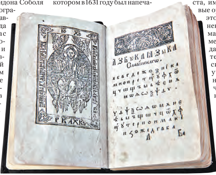
Букварь был небольшой, легко помещался в кармане.

Букварь Спиридона Соболя был настоящим произведением искусства. Титульный лист украшала гравюра Иисуса Христа, имелись красивые орнаменты. Все это было выполнено искусными мастерами. Кроме того, книга издавалась для детей: «Букварь, сиречь, начало учения детям, начинающим чтение изыскати». Поэтому томик был недорогой, красочно оформленный и маленький, чтобы можно было положить в карман.