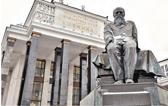
Когда-то в читальном зале библиотеки работал сам Федор Достоевский. А еще Антон Чехов, Лев Толстой...

С 1862 года библиотека стала получать обязательный экземпляр всей печатной продукции России.