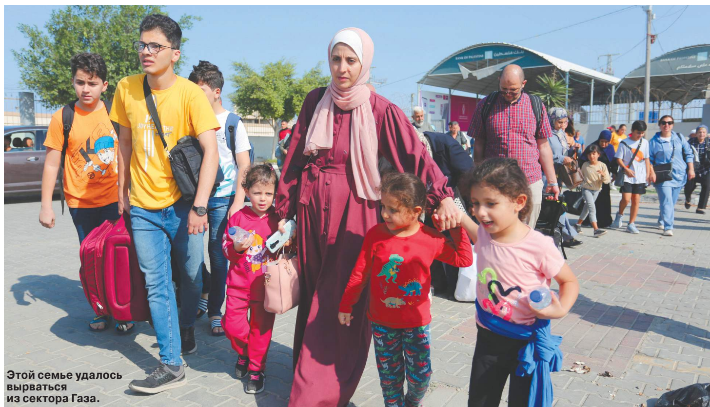
Этой семье удалось вырваться из сектора Газа.

Россияне в Газе готовы обратиться к Путину: помогите с эвакуацией