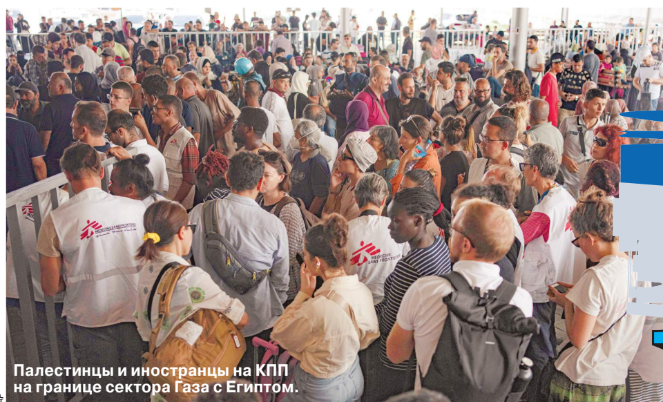
Палестинцы и иностранцы на КПП на границе сектора Газа с Египтом.