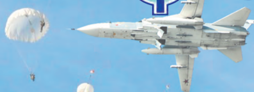
Андрей Николаевич СЕРДЮКОВ – Командующий Воздушно-десантными войсками, генерал-полковник