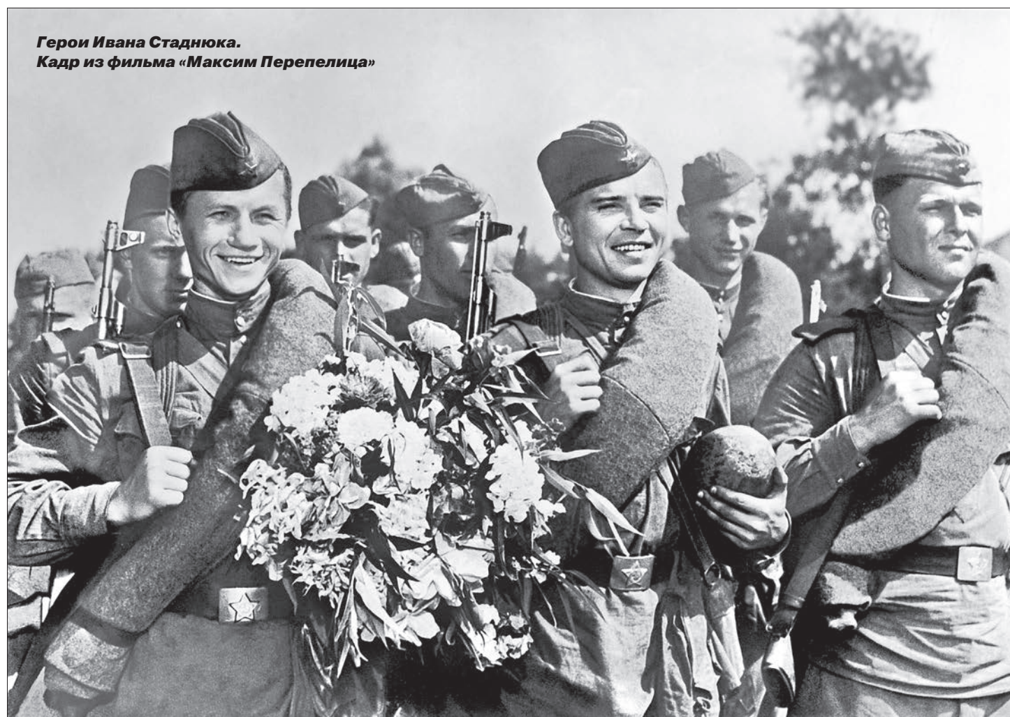
Герои Ивана Стаднюка. Кадр из фильма «Максим Перепелица»

Исполнилось 100 лет со дня рождения автора «Максима Перепелицы»