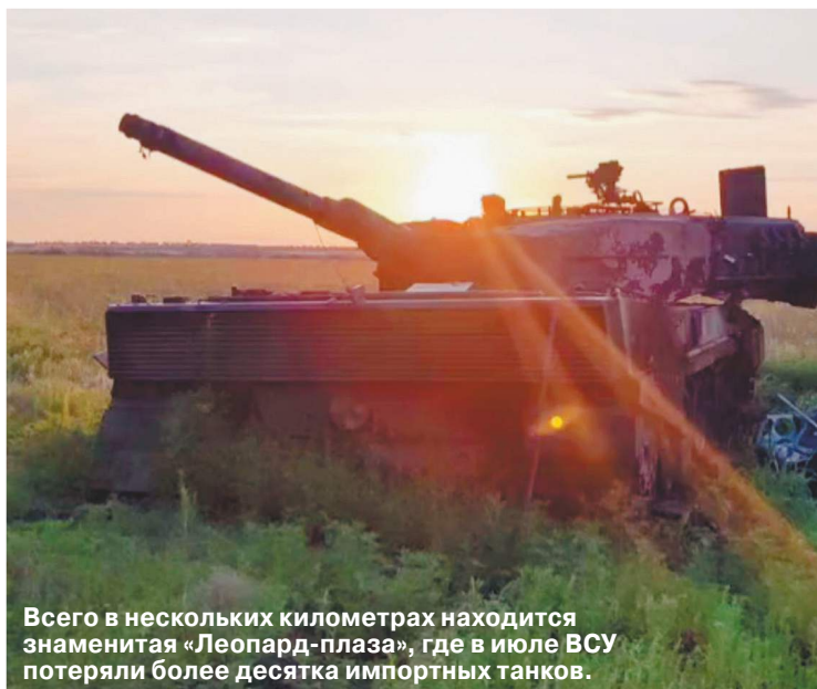
Всего в нескольких километрах находится знаменитая «Леопард-плаза», где в июле ВСУ потеряли более десятка импортных танков.