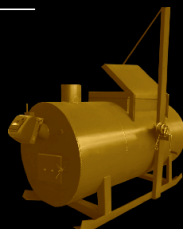
для биологических отходов

Компания Bonkraft предлагает к поставке установки собственного производства для высокотемпературного термического уничтожения и обезвреживания твердых бытовых, медицинских и биоорганических отходов различной производительностью и объемом загрузки.