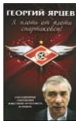
Матвеев А. Георгий Ярцев. Я плоть от плоти спартаковец. М.: Эксмо, 2012. — 288 с. — (Спорт в деталях).

6 Когда-то спартаковцев было не остать — они на всех парах мчались в высшую лигу. Тогда, в середине и конце 1970-х, за лучший столичный клуб играл он, «быстрый, резкий, техничный, всегда нацеленный на ворота соперников», лучший бомбардир первенства — Георгий Ярцев — в будущем главный тренер красно-белых, победитель чемпионата страны и прекрасный рассказчик.