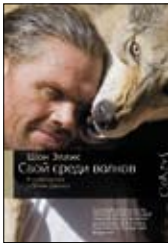
Эллис Ш. Свой среди волков / Пер. с англ. А.Тихонова. М.: Corpus, 2012. — 352 с.

2 Он жил в волчьей стае, ел, спал, рычал и дрался как волк, освоил искусство художественного воя и воспитания щенков, но его зовут не Маугли. Британский натуралист Шон Эллис — абсолютно реальный человек, и в этой книге он подробно рассказывает о своем экстремальном опыте единения с мохнатой и зубастой природой.