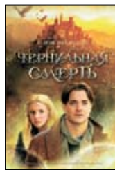
Функе К. Чернильная смерть: Роман-фэнтези / Пер. с нем. М. Сокольской. М.: Махаон, Азбука-Аттикус, 2012. — 672 с.: ил. — (Чернильное сердце).

7 Немного детектива, чуть-чуть романа воспитания, вдоволь волшебства и уйма приключений — это про все, что следует за словом «чернильное»: будь то сердце (первая книга), кровь (вторая) или смерть (третья и заключительная). Мегги блуждает по Чернильному миру, в котором оказалась благодаря чудесному дару своего отца — читая книги вслух, оживлять персонажей.