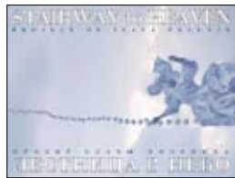
Лестница в небо. Проект Славы Полунина. М.: Академия дураков, 2011. — 103 с.

5 «Белый карнавал», проект-мечта Славы Полунина и его друзей из разных стран — волшебное действо карликов, гигантов, снежных метелей и людей-бабочек, — уже радовал и ошеломлял любителей чудесного в Москве, Петербурге, Париже и даже в пустыне Невада. Теперь у него появилось еще одно воплощение — книжное.