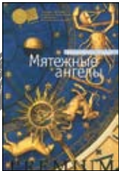
Дэвис Р. Мятежные ангелы / Пер. с англ. Т.Боровиковой. СПб.: Азбука, 2012. — 384 с.

1 «Дептфордская трилогия» канадского классика Робертсона Дэвиса уже хорошо знакома отечественному читателю. Встречайте «Корнишскую трилогию» и ее первый роман — «Мятежные ангелы». В этой хитрой истории об одном спорном наследстве затейливо переплелись искусство, религия, криминал и, кажется, самая настоящая цыганская магия.