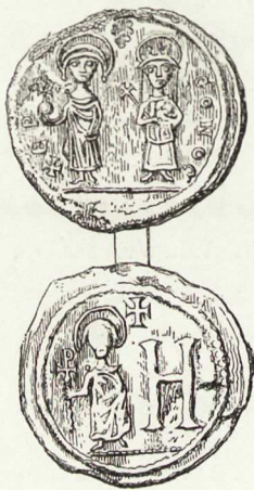
2. Мѣдная монета Максимиана Тиберія (582—602), чеканенная въ Херсонесѣ.

Все внутреннее пространство застроено было городскими зданіями, теперь представляющими однѣ груды развалинъ, на двѣ трети еще не разслѣдованныхъ. Одна улица, шириной въ три сажени, начинаясь у южныхъ стѣнъ, идетъ по всему городу на сѣверо-востокъ къ морю и въ этомъ пунктѣ представляетъ особенно хорошо сохранившіяся жилища. Въ восточной части ее пересѣкаютъ, по направленію къ сѣверному берегу, еще двѣ улицы, также доходящія до моря, и замѣчательныя развалины крестообразной церкви, на стѣнахъ которой еще были остатки фресокъ во время открытія ея раскопками Одесскаго Общества Исторіи и Древностей.