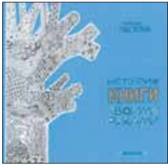
Прудовская С. История книги своими руками: Для ср. шк. возраста. М.: КомпасГид, 2011. – 56 с.: ил.

2 На глиняных табличках и деревянных дощечках, на коре и листьях, на ткани, папирусе, пергаменте и наконец бумаге — люди писали почти на всем, что было вокруг. Путь длиною в 4500 лет! Светлана Прудовская — искусствовед и художник — проходит его заново, рассказывая, какими были книги до того, как их стали так называть.