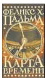
Пальма Ф. Х. Карта времени / Пер. с исп. Е.Матерновской, И.Новосадской, Н.Богомиловой. М.: Астрель, Corpus, 2012. — 640 с.

5 Лондон, конец XIX века, инновации прямо-таки витают в воздухе, и кто сказал, что мы вот-вот не научимся путешествовать во времени? Только в каком направлении? И чем это может быть чревато? Об этом придется серьезно задуматься мистеру Уэллсу, когда он попадет в совершенно невероятную ситуацию, достойную его романов.