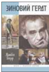
Гейзер М. Зиновий Гердт. М.: Молодая гвардия, 2012. — 288 с. — (Жизнь замечательных людей).

7 Залман Храпинович — такое имя было дано мальчику при рождении, «Великий Зяма» — так его звали в театральных кругах. Паниковский, конференсье в «Необыкновенном концерте», министр финансов в «Тени... Первая биография Гердта в серии «ЖЗЛ» составлена Матвеем Гейзером из воспоминаний многочисленных друзей артиста.