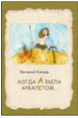
Клюев Е. Когда А была арбалетом... СПб.: Речь, – 2012.

3 Обычно книги Евгения Клюева — поэта, переводчика, драматурга и писателя — чередуются: детские и взрослые. Эта вроде бы написана для маленьких и вроде бы похожа на азбуку. Но все не так просто, а довольно чудесно. И истории, которые рассказывают о себе буквы алфавита, способны удивить и взрослого.