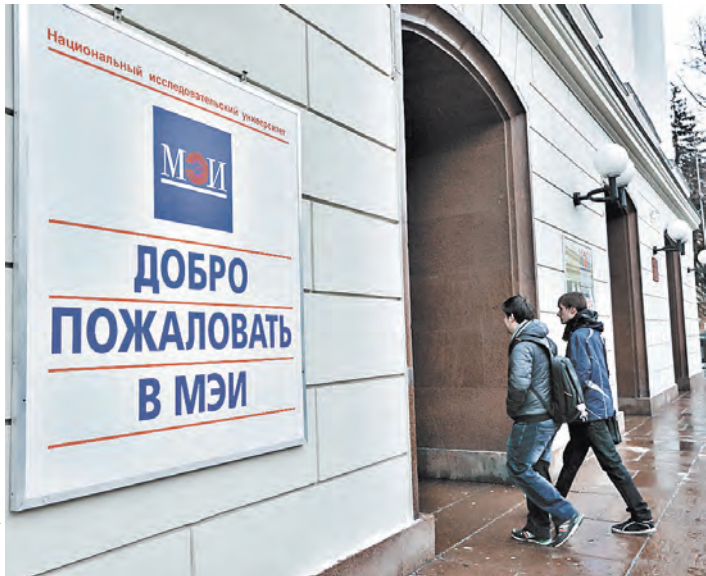
Первая в Европе кафедра атомных электростанций была открыта в 1956 году в МЭИ.