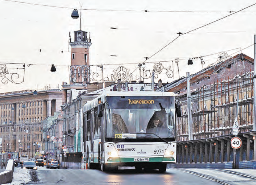
«МАЗы» для Питера изготовлены с учетом капризного климата Северной Пальмиры.

Не только петербуржцы, но и жители многих других российских регионов уже много лет пользуются автобусами минской марки. Все отмечают их комфортность, надежность и экономичность. Благодаря современному дизайну они преобразили улицы многих городов центральных, северо-западных и южных регионов России, Сибири и Урала. Не затерялись пассажирские «МАЗы» и на проспектах Москвы — там их сотни. Эксплуатируют белорусские автобусы