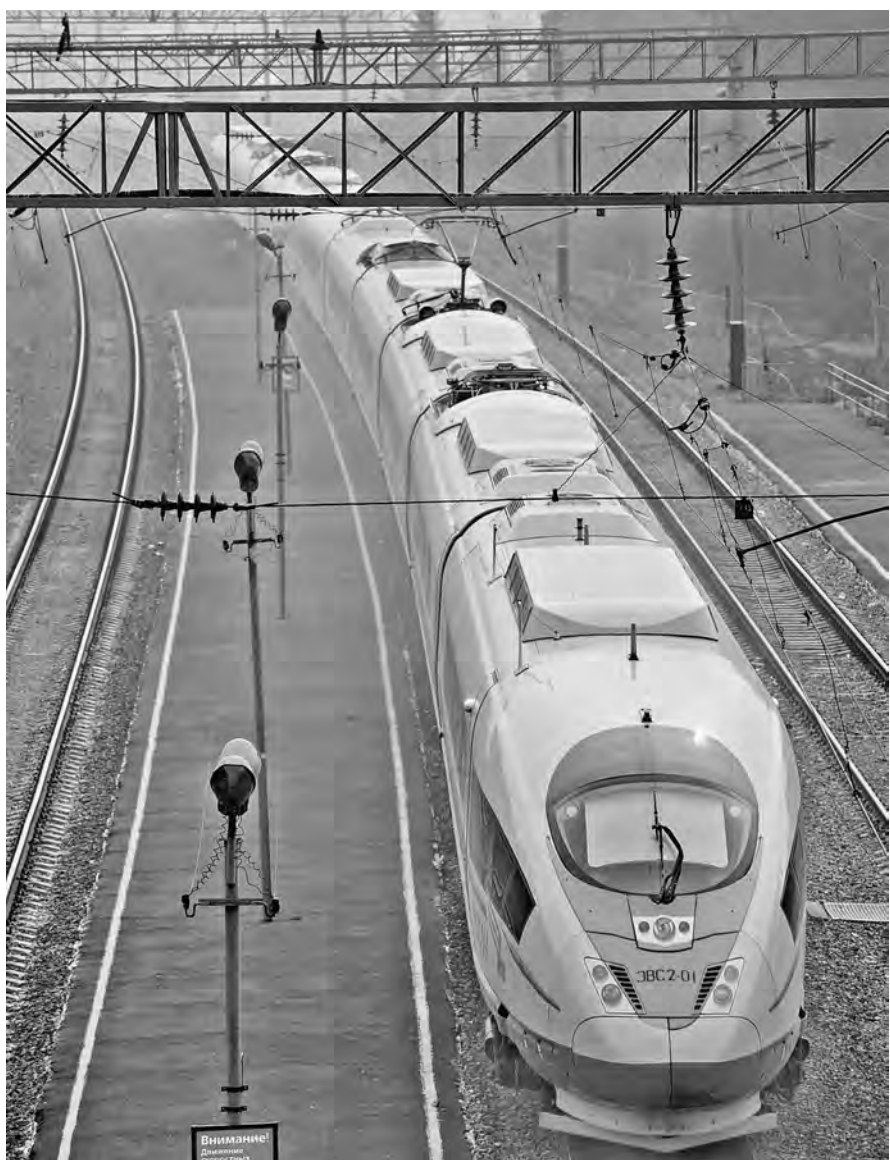
Каких только стальных тружеников за столетнюю историю ни видел Транссиб! Паровозы, тепловозы, электровозы, электрички все больше похожи на космические ракеты...