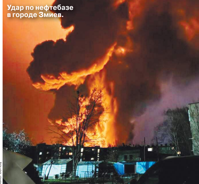
Удар по нефтебазе в городе Змиев.