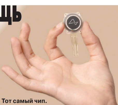
Тот самый чип.