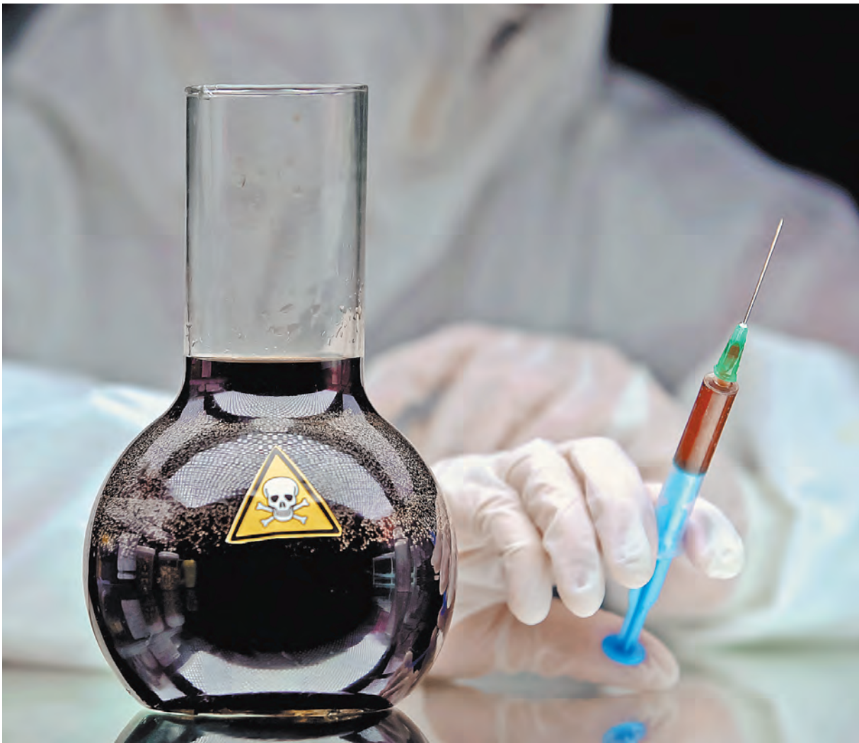
В лабораториях работали с возбудителями чумы, сибирской язвы, холеры и других смертельных болезней.