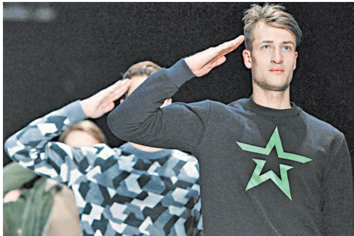
Коллекцию «Армия России» представляли в Москве под барабанный бой и военные песни. Одежда — удобная, спортивная, комфортная, а стиль милитари снова в моде.