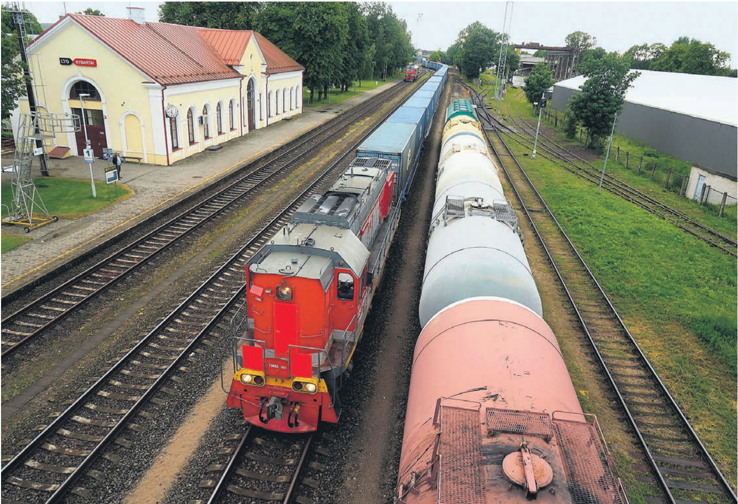
Заявление Еврокомиссии о том, что железнодорожным перевозкам подсанкционных российских товаров в Калининград ничто мешать не должно, позитивно восприняли и в Вильнюсе, и в Москве