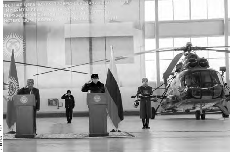
ФЕДСТАБ ВС РФ

Россия передала Киргизии партию вооружения и техники, прошедшую модернизацию в РФ. Горная республика в качестве безвозмездной военно-технической помощи получила два вертолета Ми-8МТ и две передвижные радиолокационные станции П-18. Торжественная церемония передачи прошла перед открытием саммита ОДКБ в Бишкеке—на аэродроме авиабазы ВКС России в городе Канте близ киргизской столицы.