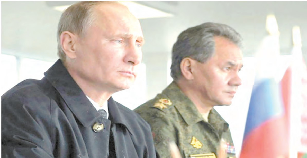
Верховный Главнокомандующий и министр обороны наблюдают за основным этапом ССУ «Запад-2021» на полигоне Мулино в Нижегородской области

Восьмое совместное стратегическое учение Вооружённых сил Российской Федерации и Республики Беларусь «Запад-2021» спланировано и организовано с учётом современной международной обстановки и глубокого понимания необходимости обеспечить надёжную защиту границ не только Союзного государства, но и других дружественных стран.