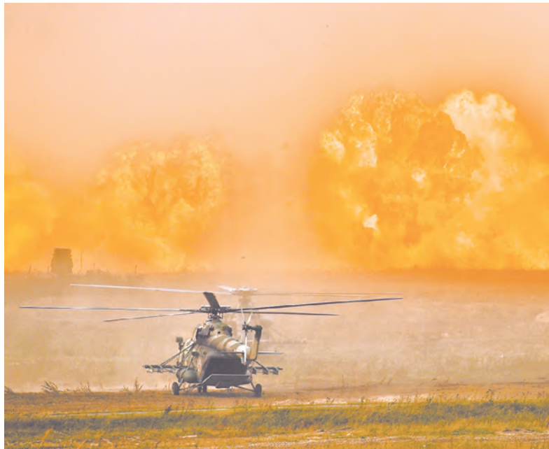
Пламя учебного боя