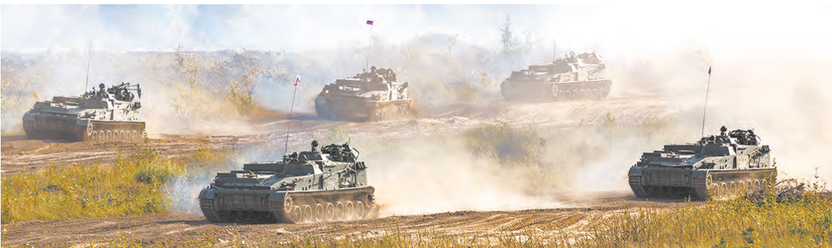
Неотразимая контратака сил коалиции