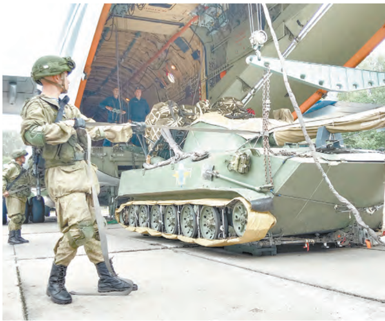
Десант привычно и сноровисто готовится к предстоящей высадке с боевой техникой в указанном объединённом командовании районе

Восьмое совместное стратегическое учение Вооружённых сил Российской Федерации и Республики Беларусь «Запад-2021» спланировано и организовано с учётом современной международной обстановки и глубокого понимания необходимости обеспечить надёжную защиту границ не только Союзного государства, но и других дружественных стран.