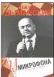
Дымарский Н. У микрофона. Репортаж о жизни. М.: Российская газета, 2013. — 216 с.