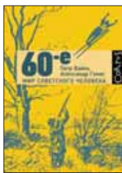
Вайль П., Генис А. 60-е. Мир советского человека. М.: АСТ, Corpus, 2013. — 432 с.

7 Она началась в 1961 году XXII съездом КПСС, принявшим программу построения коммунизма, и закончилась в 68-м оккупацией Чехословакии — маленькая противоречивая цивилизация под названием «советские 60-е». Артефакты загадочной эпохи исследуют и анализируют Петр Вайль и Александр Генис.