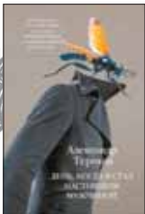
Терехов А. День, когда я стал настоящим мужчиной. М.: АСТ, 2013. — 348 с.

1 Мальчишки лысеют, полнеют, стареют, продолжают при этом играть в казаков и разбойников, искать прекрасную принцессу, упрямо утверждать, что их молодость вечна... и все-таки становятся настоящими мужчинами. По-разному, с большими и малыми жертвами. Подробности — в новом сборнике рассказов Александра Терехова.