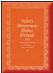
Кэрролл Л. Приключения Алисы под землей / Пер. с англ. Н. Демуровой. М.: ТриМар, 2013. —176 с.

2 До «Приключений Алисы в Стране чудес» были «Приключения Алисы под землей» — рукописная книжка, которую Кэрролл украсил собственными рисунками и подарил Алисе Лидделл. Теперь с «первой версией» великого сюрреалистического путешествия любознательной девочки может познакомиться и русский читатель.