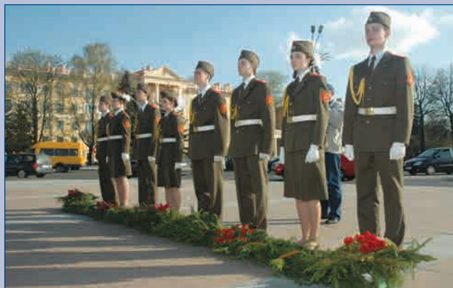
Совместно с делегацией экспедиции «Дорогами мира, дружбы и согласия» в городе-герое Минске цветы к монументу Славы в центре столицы возлагала молодежь Республики Беларусь 20 апреля 2010 г.