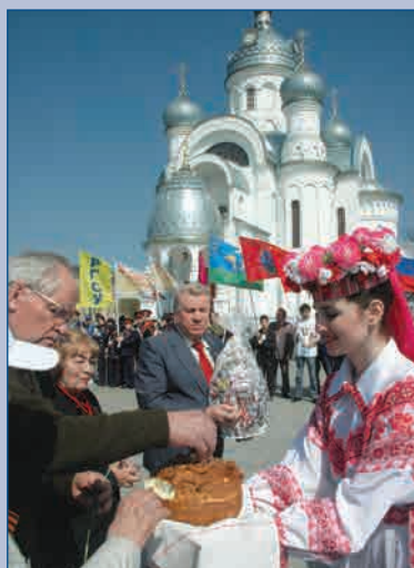
Участников экспедиции встречали хлебом и солью г. Берёза, 21 апреля 2010 г.

Более подробно о молодёжном мероприятии читайте в статье С.В. Бычкова «С миссией мира по дорогам войны».