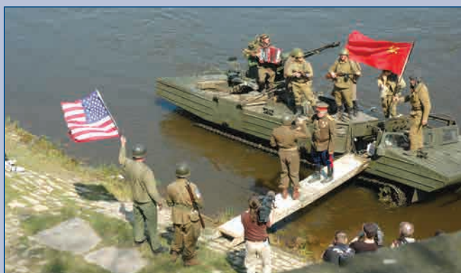
▲ Реконструкция встречи советских и американских войск на р. Эльбе 25 апреля 1945 года, подготовленная историческими клубами Германии к 65-й годовщине исторического события г. Торгау, 25 апреля 2010 г.