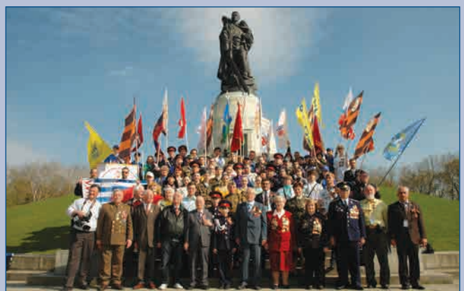
▲ Экспедиция у подножия памятника советскому солдату в Трептов-парке г. Берлин, 24 апреля 2010 г.