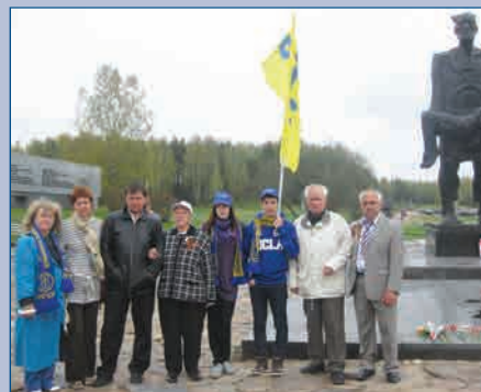
▲ Руководители региональных групп из состава экспедиции возле центрального монумента мемориального комплекса «Хатынь» 29 апреля 2010 г.