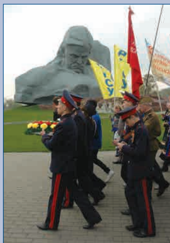
Делегация во время посещения Брестской крепости-героя направляется к р. Бугу, чтобы спустить венки на воду г. Брест, 21 апреля 2010 г.