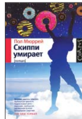
Мюррей П. Скиппи умирает / Пер. с англ. Т. Азаркович. М.: Астрель, Corpus, 2012. — 784 с.

7 Юность — волшебное время, когда всё-всё-всё вокруг тебя — любовь, смерть, страх, монстры, теория струн, секс, пончики — одинаково удивительно и кружится в неповторимом экзистенциальном танце. О нем и рассказывает школьная сага Пола Мюррея, один из лучших романов 2010 года по версии Times.