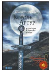
Акройд П. Король Артур и рыцари Круглого стола / Пер. с англ. Л. Сумм. М.: Альпина нон-фикшн, 2013. — 418 с.

5 Новогодний подарок для маленьких ценителей фей и драконов и больших поклонников английской литературы. Современный британский классик Питер Акройд пересказывает шедевр XV века — легенды о короле Артуре, рассказанные рыцарем-узником Томасом Мэлори.