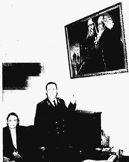
о дарок московского мэра.

С марта 1995 г. — прокурор Москвы. Государственный советник юстиции 2 класса. Женат. Имеет сына и внука. Увлечения: книги, дачное земледелие, а также (ныне — в качестве болельщика) футбол и баскетбол.