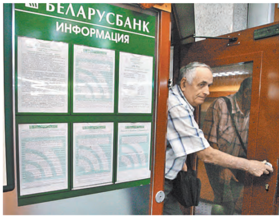
ВАДИМ РЫМАНОВ / ГАС

КОШЕЛЕК / Может ли россиянин оформить кредитную карту в Беларуси? / Страница 4