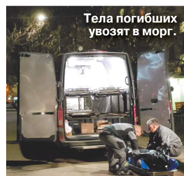
Тела погибших увозят в морг.