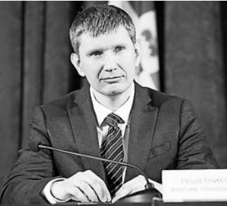
Максим Решетников: Чиновники должны выйти из кабинетов и услышать мнение простых людей

Максим Решетников — пермяк. Родился 11 июля 1979 года. В 2000 году окончил Пермский государственный университет по специальности «экономист-математик». С начала двухтысячных работал в администрации Пермской области, в