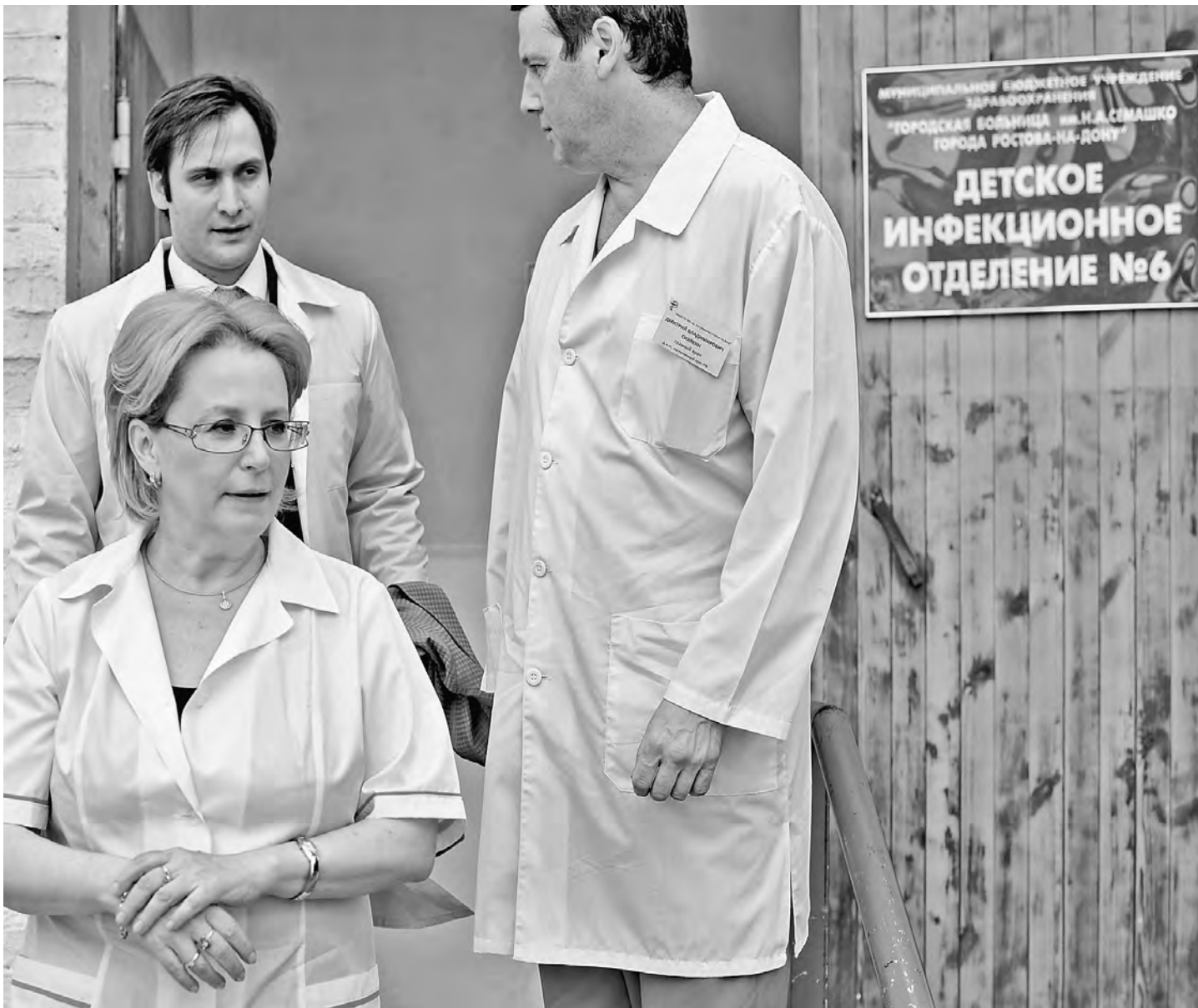
Министр постоянно бывает в медицинских учреждениях и знает, что там происходит.