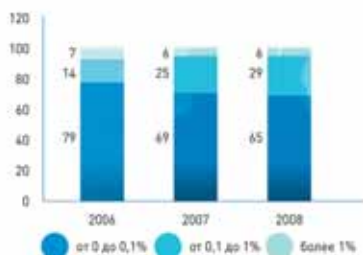
Динамика годового оборота логистических операторов