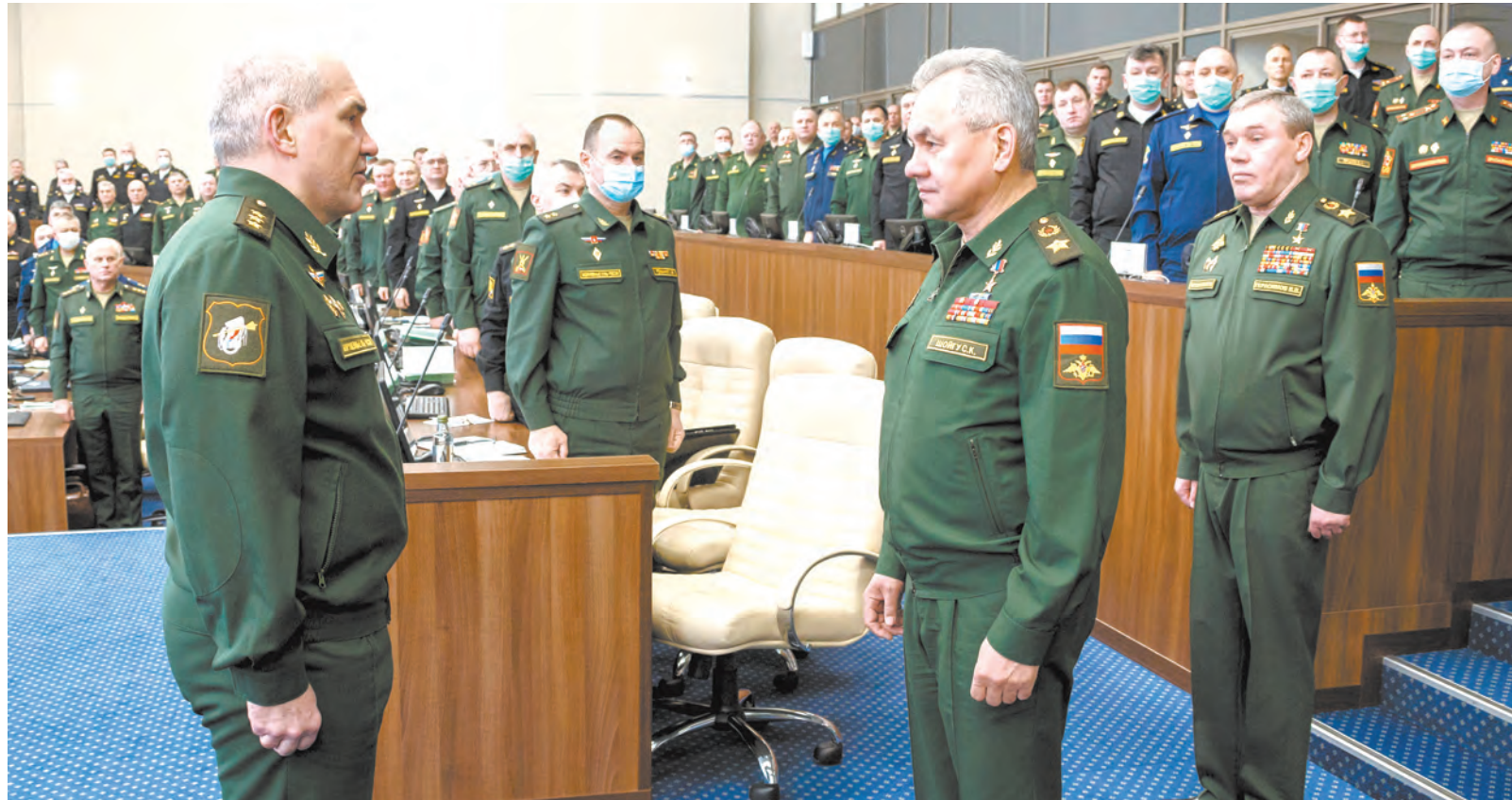
В Военной академии Генерального штаба ВС РФ

В мероприятии принимают участие руководящий состав главных командований видов ВС РФ, военных округов, Северного флота, родов войск, командова- ний объединений, руководите- ли центральных органов воен- ного управления. Всего – более 350 человек. Высшие и старшие офицеры анализируют систе- му управления межвидовыми группировками войск в военных конфликтах и способы ведения боевых действий в современных