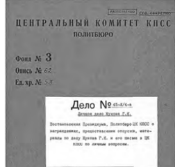
Материалы из личного дела маршала Жукова недавно рассекрестили.

Историческая правда под грифом «секретно» — остается одной из самых горячих тем. Общественное мнение склоняется к тому, что общая история не должна стать «личным делом» далеких наследников, ограничивающих доступ к документам ученым, журналистам и писателям, пишущим биографии. Мы не поймем и не осознаем историю своей страны во всей ее полноте, если будем продолжать политику архивных «белых пятен».