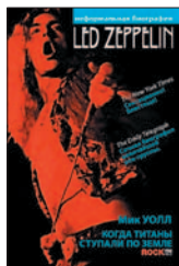
Уолл М. Led Zeppelin. Когда титаны ступали по земле / Пер. с англ. З. Мамедьярова, Е. Фоменко. М.: РИПОЛ классик, 2015. — 752 с. — (Время. Перегрузка).

4 Автор выкладывает историю рок-группы из всего, что обнаруживает, а уж внимания к самым малозначительным, кажется, деталям ему не занимать. Уоллу интересны подробности биографий, закулисные стороны творчества; он опрашивает тех и этих, читает газеты, перетрясает архивные записи — и из временного сора встают те самые «Титаны, ходившие по Земле».