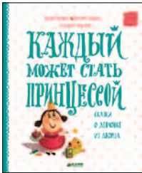
Кузякин К., Доброва Е. Каждый может стать принцессой. Сказки о девочке из дворца. М.: Клевер-Медиа Групп, 2015. — 48 с.: ил. — (Новые волшебные истории).

2 Даже в очень-очень маленьком королевстве настоящая принцесса должна много чего уметь: сделать во дворце ремонт, поймать дракона мышеловкой, залезть на яблоню в поисках ананасов, победить пиратов... А кто не спрятался — принцесса не виновата.