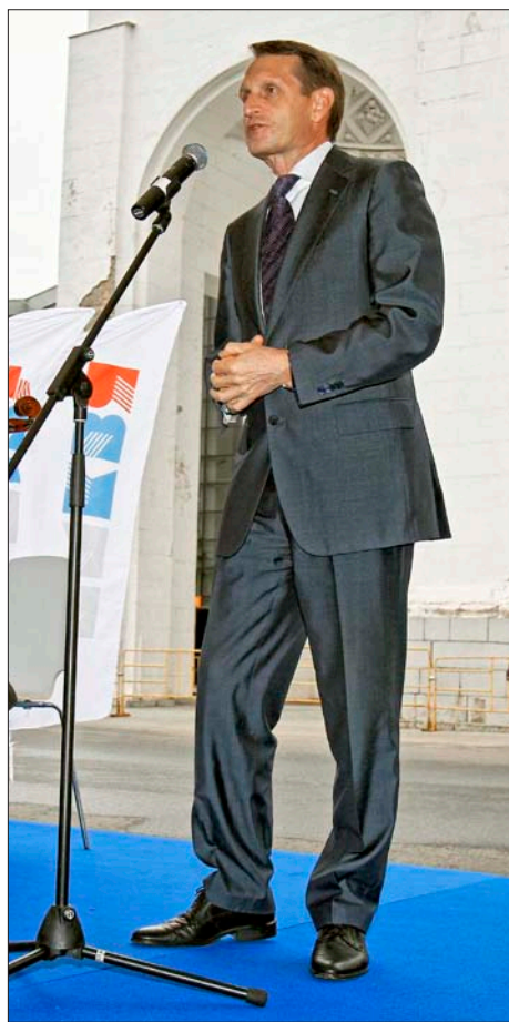
Председатель Госдумы, глава оргкомитета по проведению Года литературы в РФ Сергей Нарышкин

«Учебником XXI века» жюри признало комплект книг, выпущенных якутским издательством «Бичик». («Литературное чтение для 1–4 классов»).