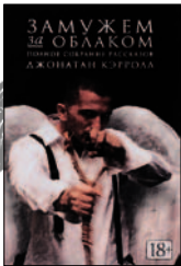
Кэрролл Дж. Замужем за облаком. Полн. собр. рассказов / Пер. с англ. В. Дорогокупли, М. Кононова. СПб.: Азбука; Азбука-Аттикус, 2015. — 544 с.

1 Зачем люди превращаются в долларовую банкноту, крадут гравитацию, делают на руке татуировку «Элизабет Хрень», вызывают мертвых и читают слова, неведомо как появившиеся у них на простынях? О, причин много — и объяснения Джонатана Кэрролла обязательно заставят вас распахнуть.