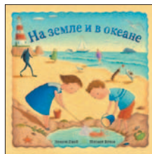
Элисон Д. На земле и в океане: Альбом; Ил. Д. Элисон; Стихи М. Яснова. СПб.: Поляндрия Принт, 2015. — 32 с.: ил.

7 Там, где синие волны встречаются с белым песком, на прибрежных камнях, в углублениях скал, среди звезд и ракушек, кипит бурная жизнь. Крабы ходят «бочком» и машут своими клешнями, осьминоги меняют расцветку, притворяясь акулами или ежами, чайки спорят до хрипоты. А мальчик, собака и кот наблюдают за ними из окна маяка, открывая их сказочный мир, как старинную книгу.