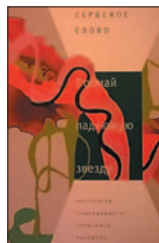
Поймай падающую звезду: Антология современного сербского рассказа / Сост. Л. Милинич; Пер. с серб. Л. Савельевой, В. Соколова. М. Центр книги Рудомино, 2015. — 288 с.

6 Критики утверждают: самое интересное в современной сербской литературе — рассказ. В сборник «Поймай падающую звезду» вошли пятнадцать рассказов наиболее интересных прозаиков Сербии. Добро пожаловать в «параллельные миры» балканской изящной словесности!