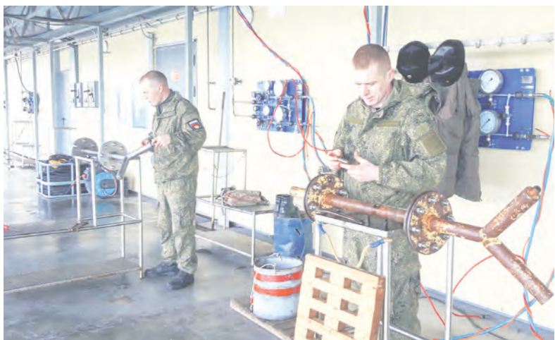
«Сборка специальной конструкции» - традиционный этап программы конкурса.

Мастера водолазного дела продемонстрировали профессионализм и мастерство