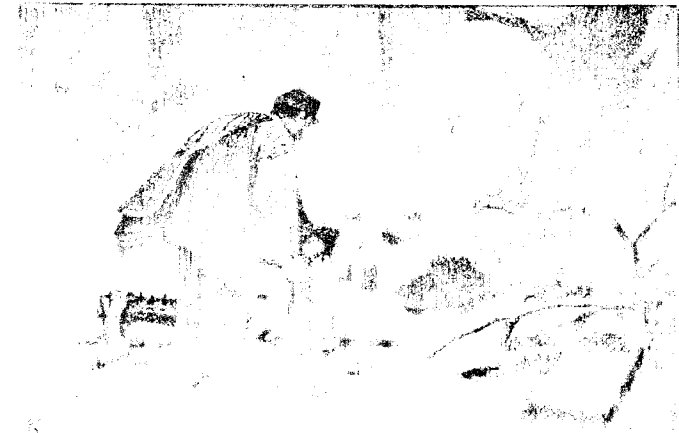
TABLE DES GRAVURES HORS TEXTE