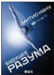
Каку М. Будущее разума / Пер. с англ. Н. Лисовой. М.: Альпина нон-фикшн, 2015. — 502 с.

4 Будущее обещает стать настоящим пиром для человеческого разума — мы сможем имплантировать новые навыки напрямую в мозг и общаться с компьютерами силой мысли, научимся форсировать свой интеллект при помощи генной терапии... Вот только готов ли наш разум к этому празднику? Об этом размышляет футуролог Митио Каку.