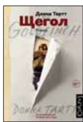
Тартт Д. Щегол / Пер. с англ. А. Завозовой. М.: АСТ; Corpus, 2015. — 827 с.

5 Взрыв в музее убил мать Тео Декера, а сам он, чудом выжив и очнувшись, получает от умирающего старика кольцо и редкую картину с наказом вынести их наружу. Осиротевшего мальчика ждет множество приключений, а украденная картина станет и тем проклятием, что утянет его на самое дно, и той соломинкой, которая поможет ему выбраться к свету.