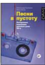
Горбачев А. Зинин И. Песни в пустоту. Потерянное поколение русского рока 90-х. М.: АСТ, 2014. — 445 с.

6 Музыкальный журналист Александр Горбачев и промоутер Илья Зинин рассказывают о «потерянном» поколении русского рока. «Песни в пустоту» — летопись исполнителей и коллективов, не собиравших стадионы, не выступавших на радио, но внесших бесценный вклад в музыкальную историю России конца века.