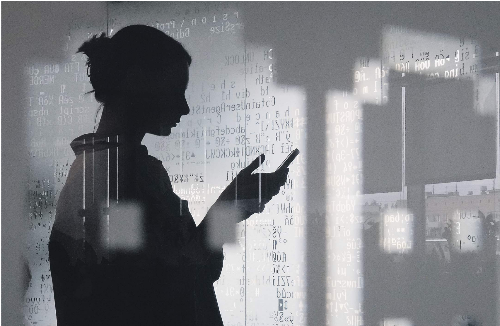
Дмитрий Коротаев / Иллюстрация

В частности, кодекс должен установить единый для отрасли понятийный аппарат: сейчас он располагается более чем в десяти нормативных правовых актах, отмечают авторы концепции.