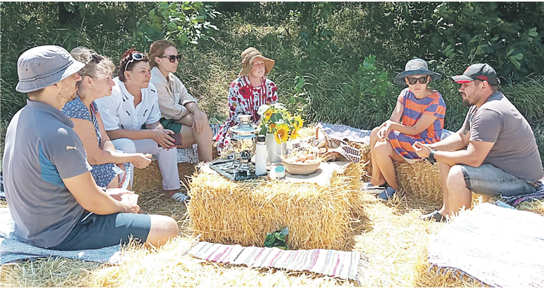
БИО ХУТОР «ПЕТРОВСКИЙ»

ОТДЫХ СО СМЫСЛОМ Две донские агрофирмы получили 20 миллионов рублей на развитие агротуризма