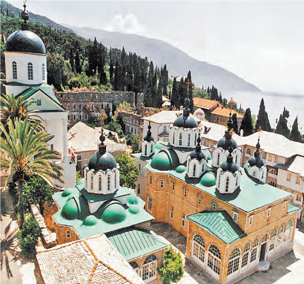
Свято-Пантелеимонов монастырь на Афоне—уникальное место, откуда люди возвращаются, по словам патриарха Кирилла, другими.

Дмитрий Медведев провел заседание попечительского совета Афонского Свято-Пантелеимонова монастыря. Это один из 20 монастырей на Святой горе. Первое упоминание о нем как поселении русских монахов датируется 1016 годом. Восстановление Свято-Пантелеимонова монастыря ведется с 2012 года, идея создания фонда помощи обители принадлежит Медведеву, тогда бывшему президентом, и патриарху Кириллу. На его восстановление за это время собрано свыше 1 млрд рублей. Глава РПЦ рассказал, что в прошлом году побывал на Святой горе и поделился ощущением, что это место обладает огромным духовным потенциалом. «Это чувствуют не воцерковленные люди, кто лишь иногда по любопытству посещает это место, но чувствуют и те, кто, будучи утомленным условиями современной жизни, перегруженным стрессами, приезжают на Афон и действительно возвращаются оттуда другими». На заседании говорилось, что таких объемов восстановительных работ, которые сегодня выполняет Россия, на Афоне еще не было. Премьер потребовал ужесточить контроль за расходованием средств, чтобы к 2016 году, 1000-летию присутствия русских монахов на Афоне, монастырь был полностью восстановлен.