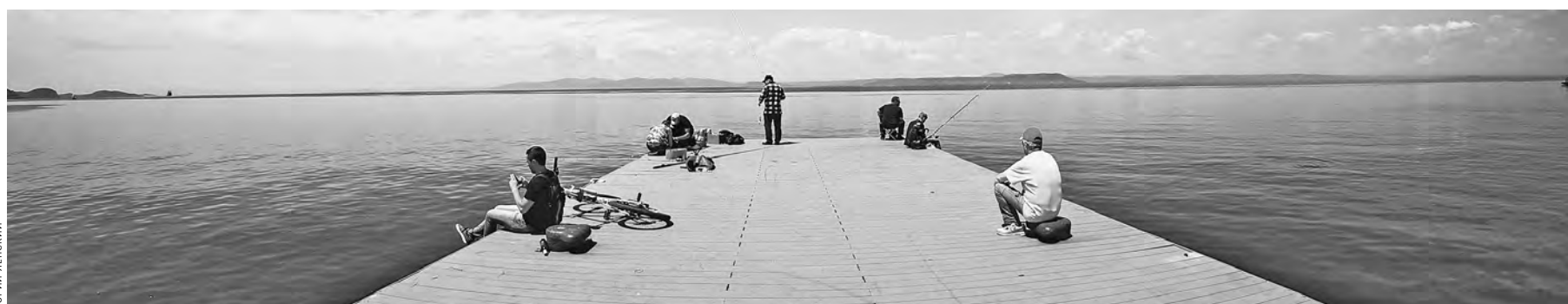
Дальний Восток манит сегодня не только туристов, многие готовы приехать сюда осваивать дальневосточные гектары, причем даже из центральной части страны.

РЕШЕНИЕ Глава МОК нашел выход из трудной для нас ситуации