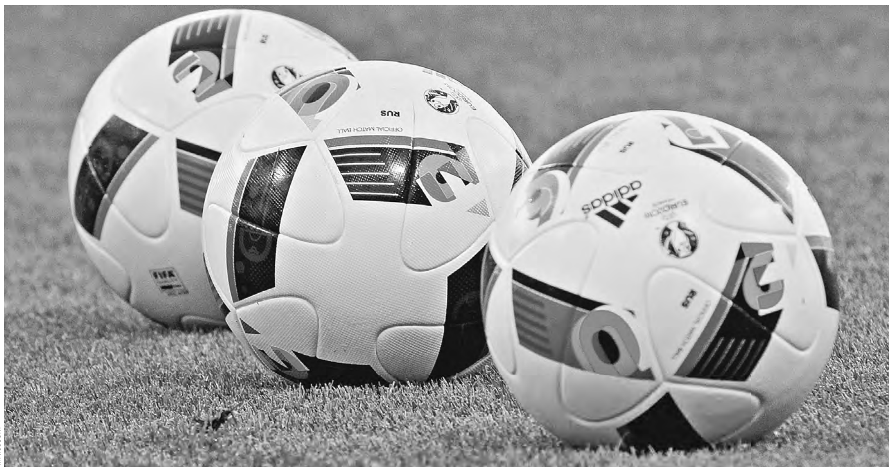
Эти три мяча от футболистов Уэльса и отправили нашу сборную домой.