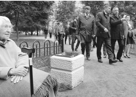
Какие дворы и скверы нужно благоустроить — решают горожане.