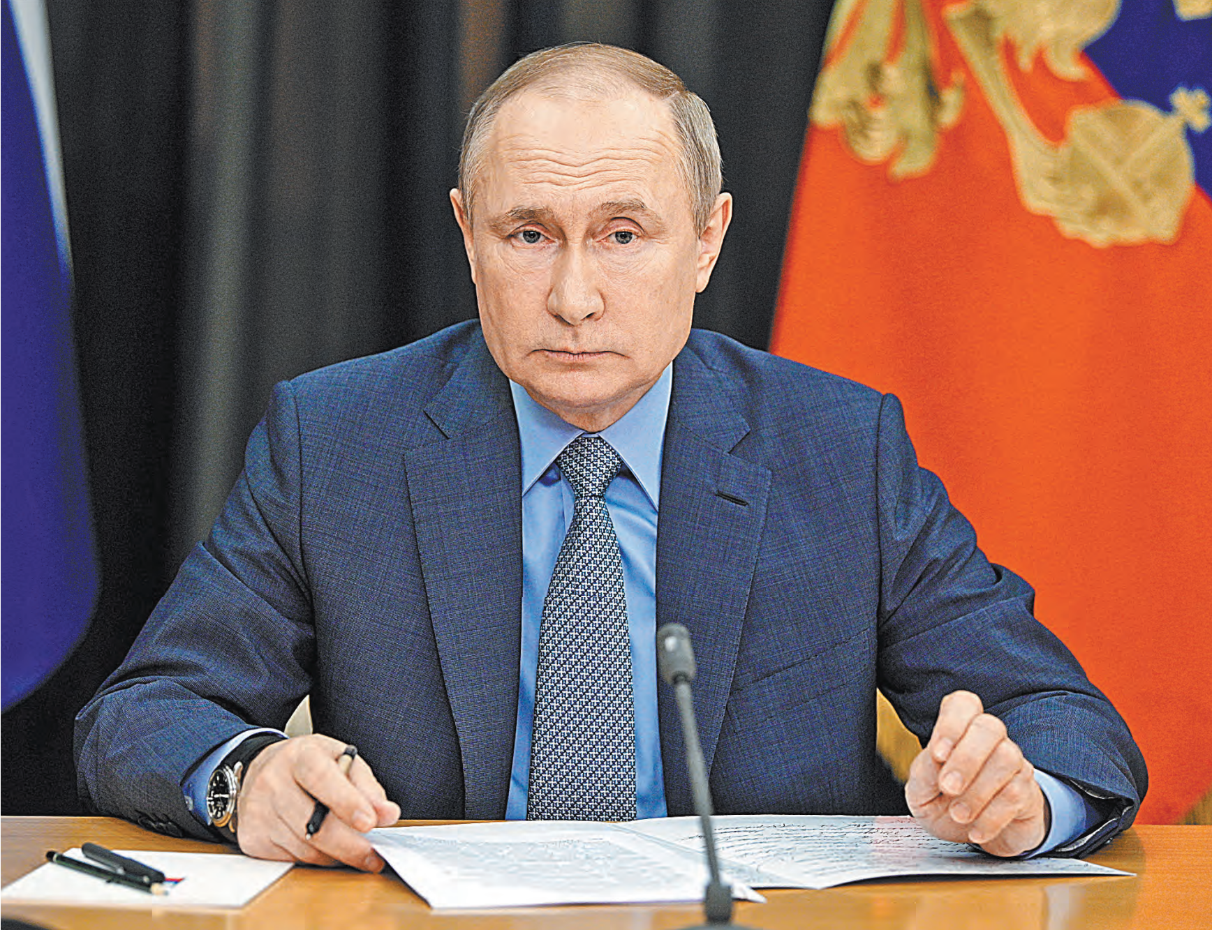
Владимир Путин подписал указ о назначении выборов в Госдуму, а ЦИК утвердил порядок проведения голосования.

— дистанционное электронное голосование. Уже известно, что оно пройдет в семи регионах. Это Нижегородская, Кур-